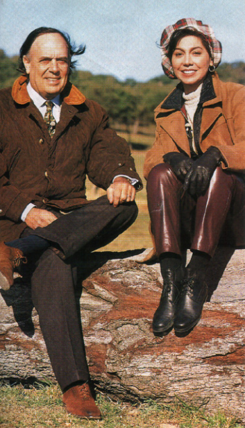
El Marqués, de 57 años, junto a la popular ex "chica del tiempo" de Telemadrid, que a partir de enero presentará un nuevo programa cultural.