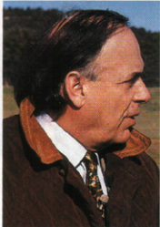
El ex de Isabel Preysler fue papá de un niño, Duarte, hace dos meses.